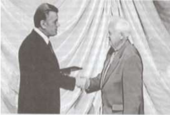
Президент України Віктор Ющенко вручає орден "За заслуги" III ст. Андрію Климу

Восени 1995 р. на обласній установчій конференції