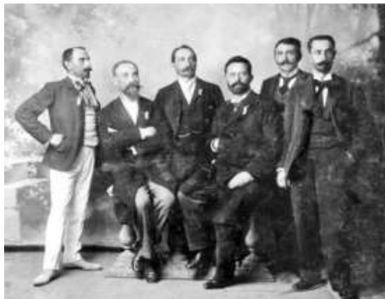
Іван Горбачевський (другий ліворуч) серед українських делегатів XIII Міжнародного конгресу лікарів (Париж, 1900 р.)

Наприкінці 1877 року Горбачевський закінчив медичні студії, захистив дисертацію й добув ступінь доктора всіх лікарських наук. Це дало змогу йому цілковито присвятити себе викладацькій роботі та розпочати низку лабораторних досліджень, що, врешті-решт, завершилися відкриттям світового значення.