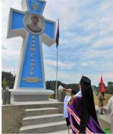
Пам'ятний хрест Климів Савури (Оржів)

На місці смерті в урочищі Лісничівка, поблизу селища Оржів на Рівненщині встановлено пам'ятний знак.