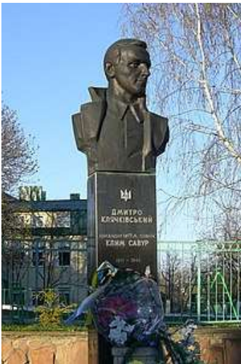
Пам'ятник Климу Савуру (Збараж)