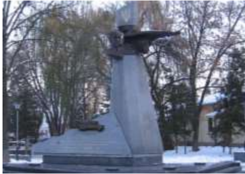
Пам'ятник Климу Савуру у Рівному