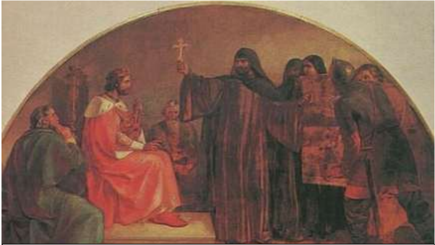
Вибір релігії князем Володимиром, художник Ф.С. Зав'ялов

суперечок з Візантією вона звернулася в 959 р. до імператора Римської імперії Оттона I, щоб він прислав єпископа, та згодом відмовилася від опіки римської церкви. До кінця свого життя Ольга підтримувала християнську церкву.