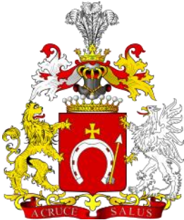
Герб графів Шептицьких

Блаженний Священномученик Климентій Казимир Шептицький – Блаженний Католицької Церкви, церковний діяч і архімандрит монахів Студійського уставу, брат Слуги Божого митрополита Андрея Шептицького. Був послом до Галицького сейму та Віденського парламенту, заступником голови Господарського Товариства.