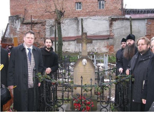
Символічна могила (кенотаф) Климентія Шептицького на Князь-Владимирському цвинтарі у Владимирі

15 січня 1948 року Климентія Шептицького засудили до 8 років виправно-трудоx таборів за «зраду батьківщини». Термін 78-річний єпископ відбував у Владимирському централі. Через постійні хвороби більшість ув'язнення провів у лазареті.